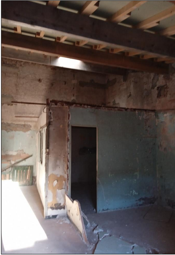
23 rue du Four Saint François