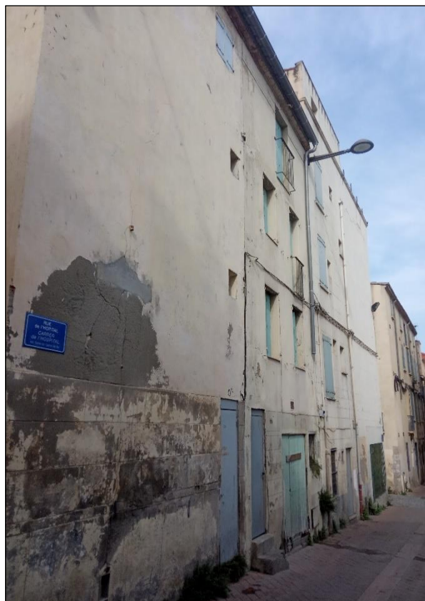
rue de l'Hôpital