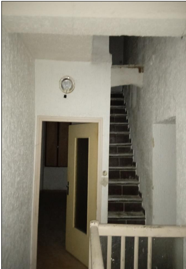
49 rue François Arago