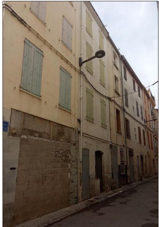
rue François Arago