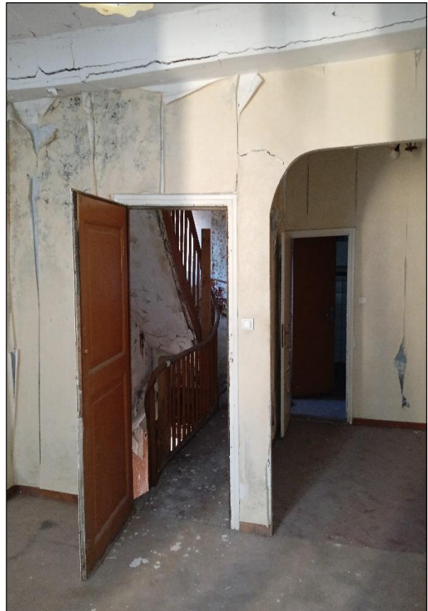
41b rue François Arago