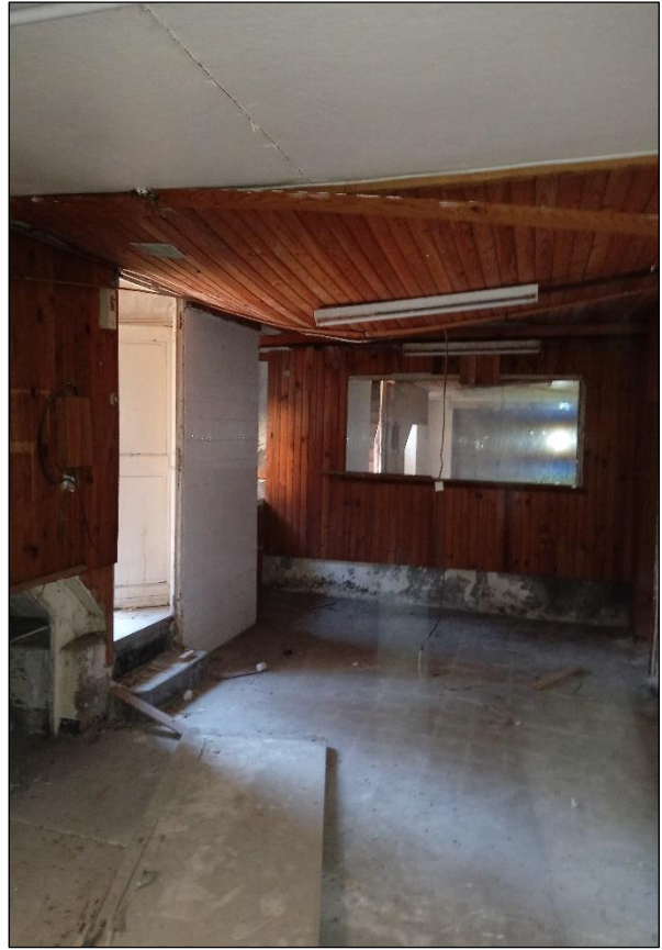
41b rue François Arago