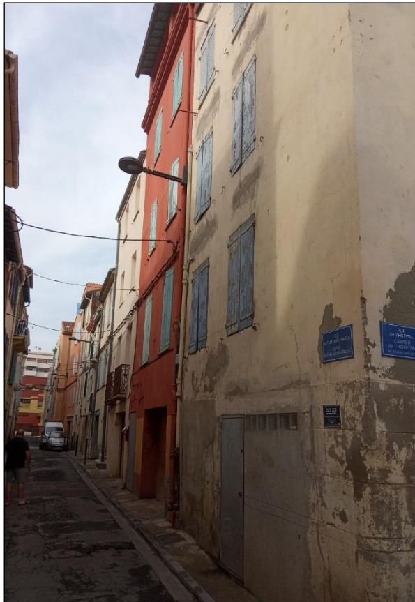
rue du Four Saint François