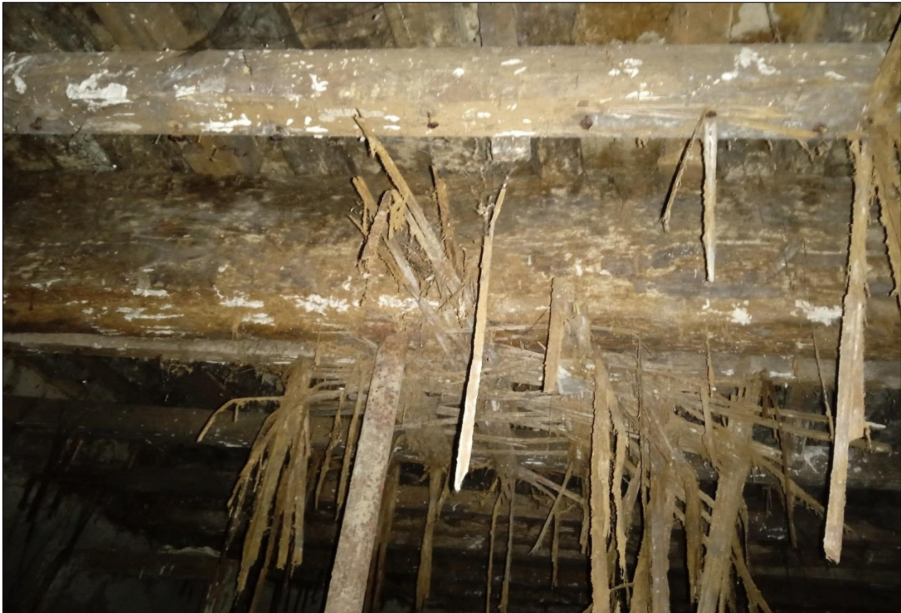
Plancher haut rdc